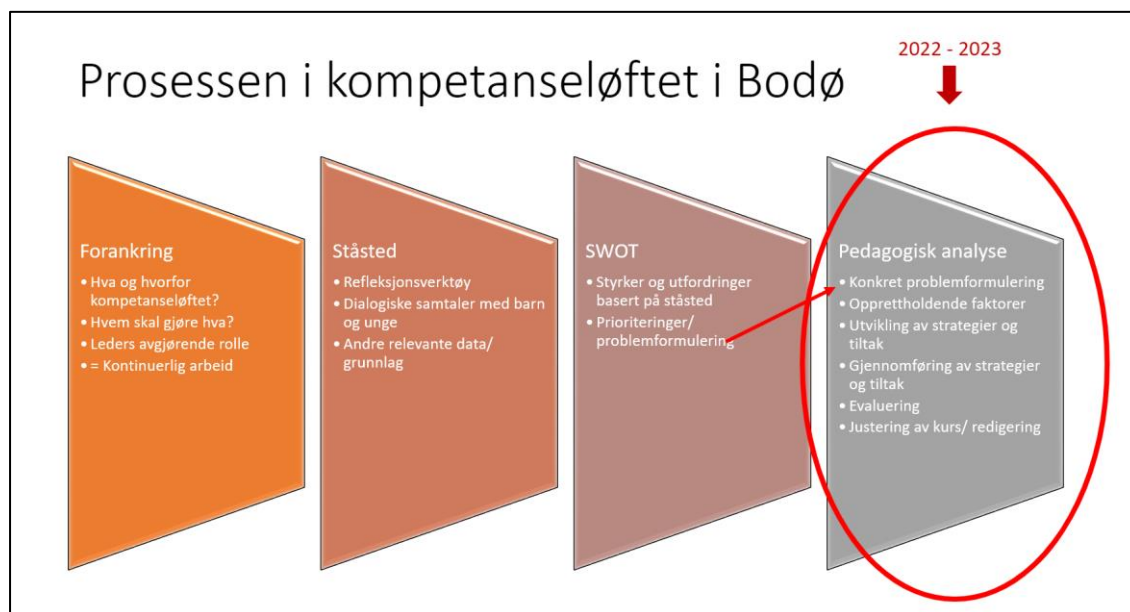
Figur 1: Proessen i Kompetanseløftet i Bodø i perioden 2021-2023

Nedenfor beskrives planlagte tiltak i Kompetanseløftet det kommende året, og sammenhengen mellom de prioriterte tiltakene synliggjøres.